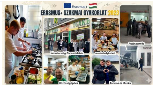
Erasmus+ szakmai gyakorlat – munkahelyi tapasztalatok (2023)