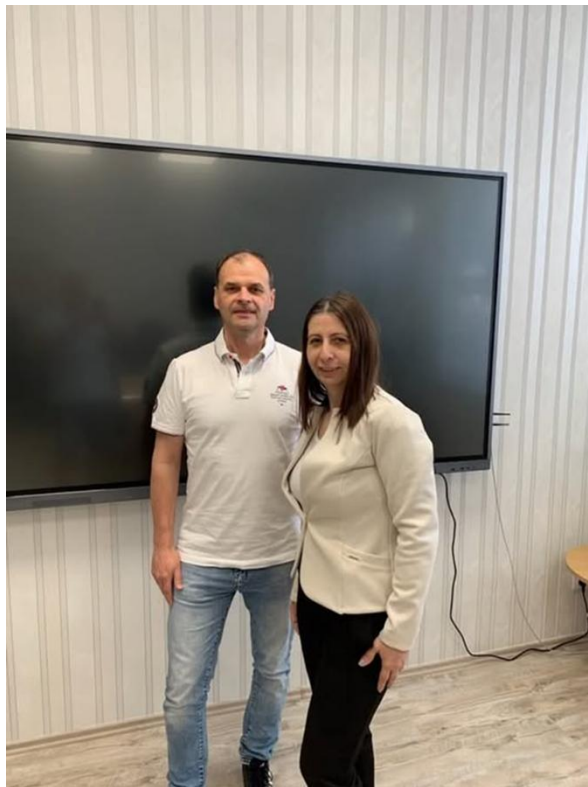
Közös fotó Matus Attila Imre kancellár úrral