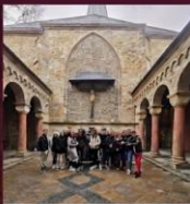
KATEDRÁLIS UDVAR: TÖRTÉNELEMLECKE