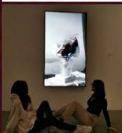
KULTÚRA ÉS MŰVÉSZET: MUSEUM FOLKWANG