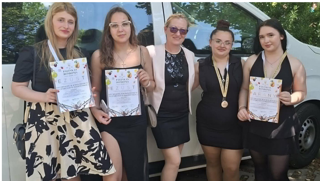
A pék-cukrász tanulók a versenyen elért eredményekkel

Köszönjük a Kisvárdai Szakképzési Centrum vezetőinek, hogy támogatták a versenyen való indulást.