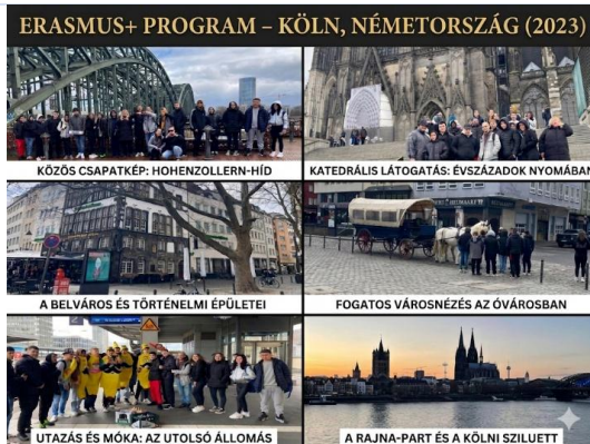
Köln, Németország – városnézés és közös programok (2023)