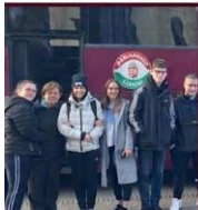
A DIÁKOK ÉS A KÍSÉRŐTANÁROK CSAPATA