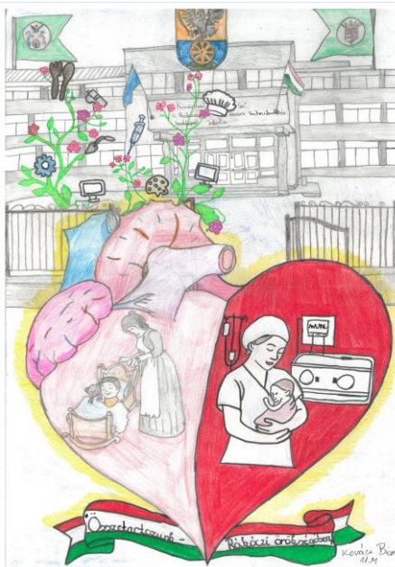
Szerző: Kovács Bianka, 11.M • Cím: Összetartozunk