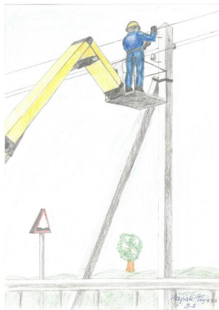
Szerző: Hápak Tárász, 9.S • Cím: Én a villanszerelő