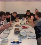
KÖZÖS VACSORA ÉS TERVEZÉS