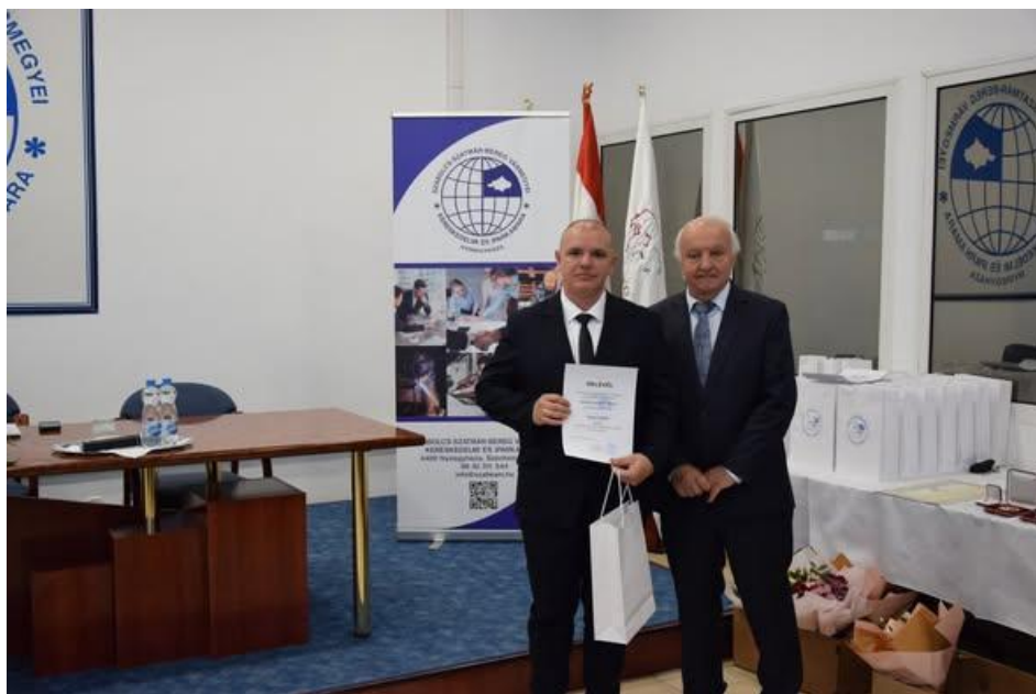
A díjátadás pillanata