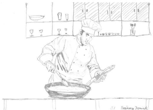
Szerző: Székely Dominik, 9.1 • Cím: Szakács Szakma