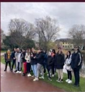
HAGYOMÁNYOS PARK, MODERN VÁROS