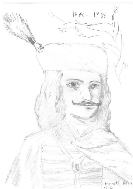
Szerző: Horváth Alex, 10.C • Cím: Rákóczi