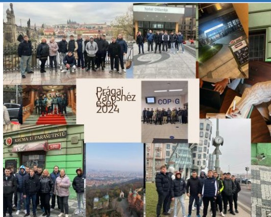
Prágai összkép és szakmai pillanatok (2024)