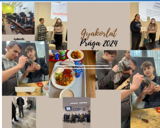
Prágai szakmai gyakorlat – programmontázs (2024)