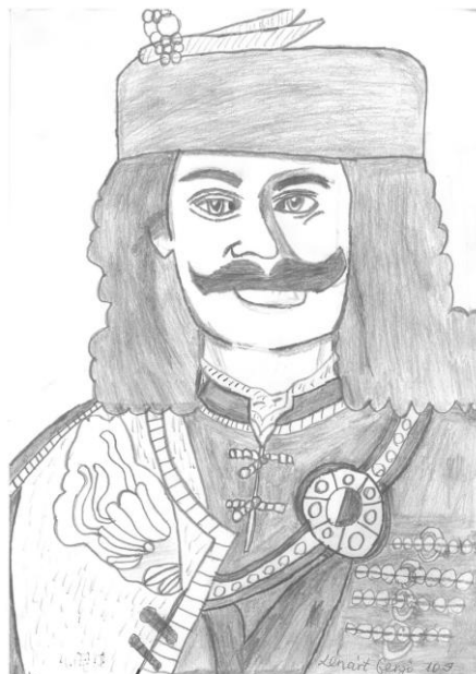
Szerző: Lénárt Gergő, 10.J • Cím: Rákóczi