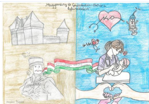
Szerző: Kovács Bianka, 11.M • Cím: Hagyomány és Gondoskodás