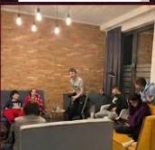
SZABADIDŐ ÉS PIHENÉS