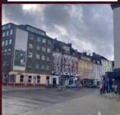
ESSENI UTCAKÉP: AZ ÚJ KÖRNYEZET

Essen, Németország – programképek (2021)