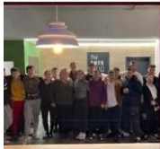
A SZÁLLÁS: THE BUNK HOSTEL