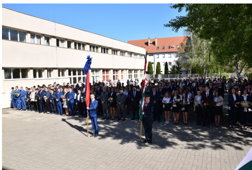
A végzős osztályok közös búcsúja.