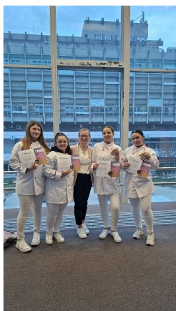
Cukrásztanulóink eredményesen szerepeltek.

Gratulálunk a diákoknak és felkészítő oktatóiknak!