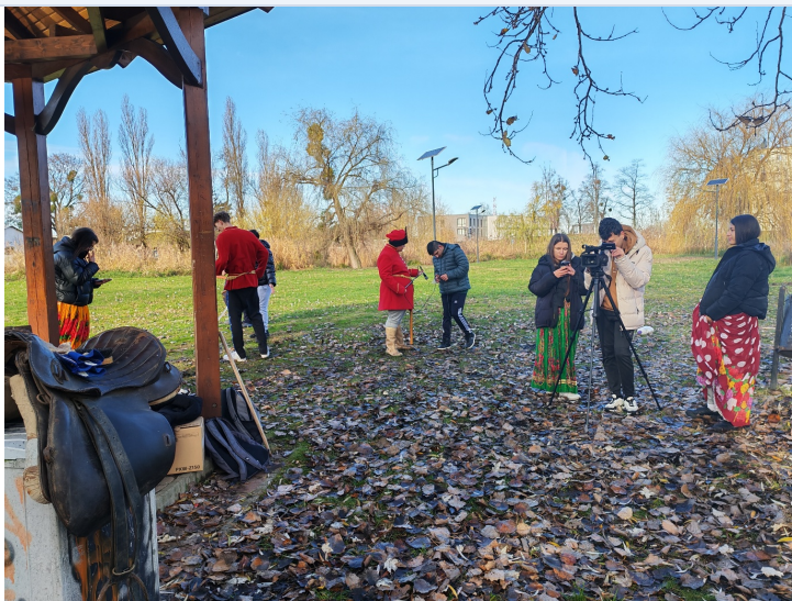
A felkészülés egyik szabadtéri állomása.

A „Rákóczi harcosai” csapat országos döntőben állt dobogóra.