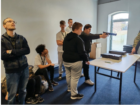
Versenyfeladat teljesítése a döntőben.