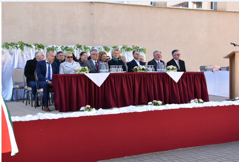
A 2026-os ballagási ünnepség ünnepi pillanatai.

Ünnepi pillanatok, megható búcsúbeszédék és rangos elismerések tették emlékezetessé a 2026-os ballagást a Kisvárdai SZC II. Rákóczi Ferenc Technikum és Szakképző Iskolában.