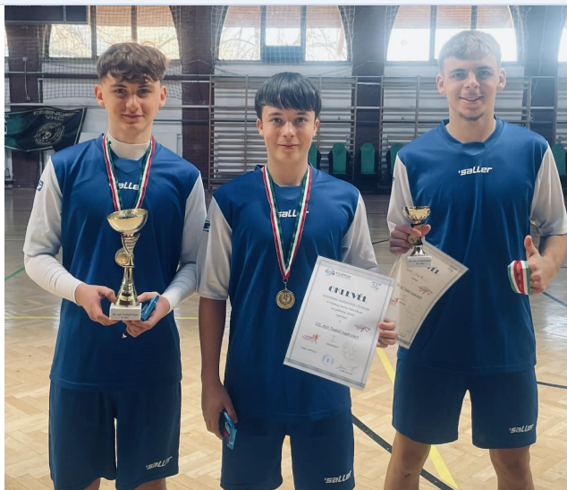
Tanulóink eredményesen szerepeltek az országos mezőnyben.

Egyéni és páros kategóriában is erős mezőnyben álltak helyt tanulóink.