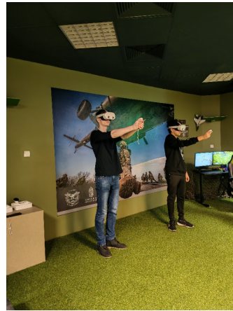
Lövészeti és VR-gyakorlat a felkészülés során.