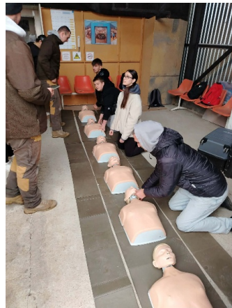
Egészségügyi és elsősegélynyújtási feladatok.