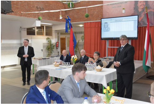
Közösségi emlékezés névadónk öröksége előtt.