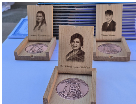
Elismerések és díjak a ballagási ünnepségen.