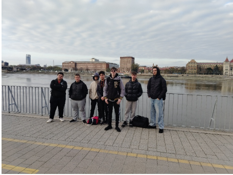
A budapesti döntő egyik közös pillanata.