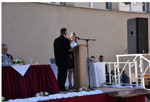
Az intézmény közössége együtt köszöntötte a végzősöket.