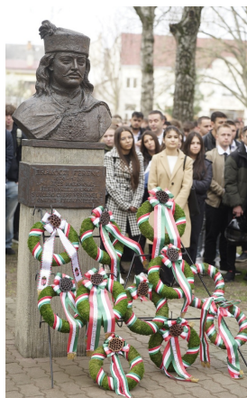
Koszorúzás II. Rákóczi Ferenc szobránál.