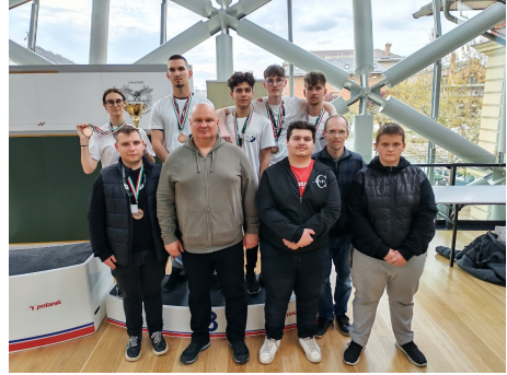
A csapat az eredményhirdetés után.