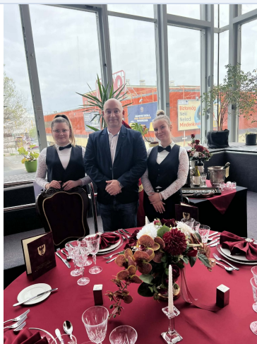
A versenyzők a Pelikán Kupán.

Ezüst minősítés, oklevél és bronzérem a szolnoki gasztronómiai versenyről.