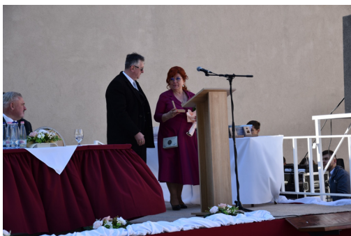
Ünnepi beszéd a ballagáson.