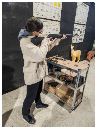
A döntő előtti gyakorlás pillanata.