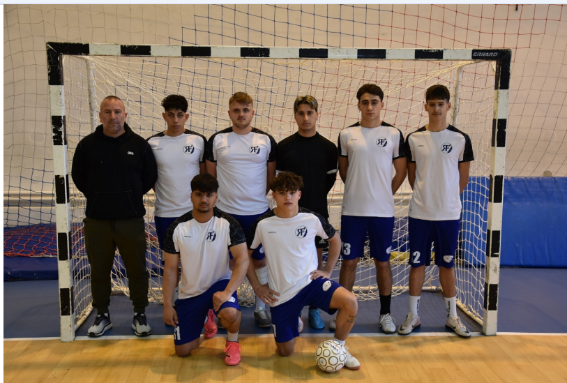
A Rákóczi-kupa győztes csapata és a sportnap pillanatai.

Egy napon idézte meg iskolánk II. Rákóczi Ferenc örökségét tudással, sporttal és ünnepi műsorral. A március 26-i program egyszerre szólt a hagyományörzésről, a közösségi élményről és arról, hogyan válhat a történelem ma is élő példává a diákok számára.