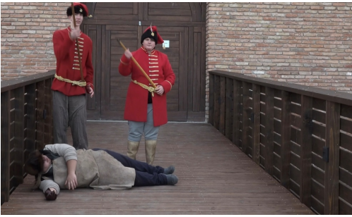
Forgatási jelenet korhű szerepekben.