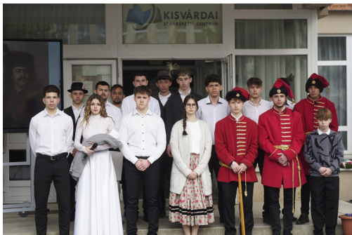
A történelmi emlékverseny és az ünnepi megemlékezés résztvevői.