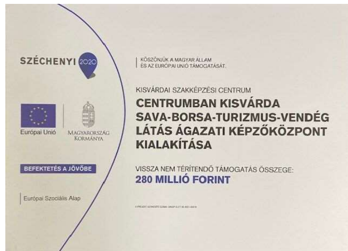
2. ábra: A projekt adattáblája 4